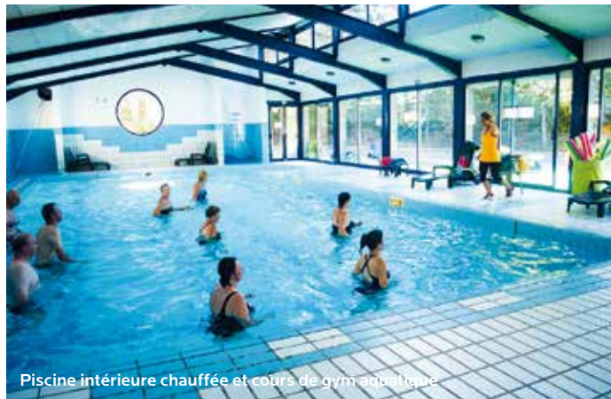
Piscine intérieure chauffée et cours de gym aquatique