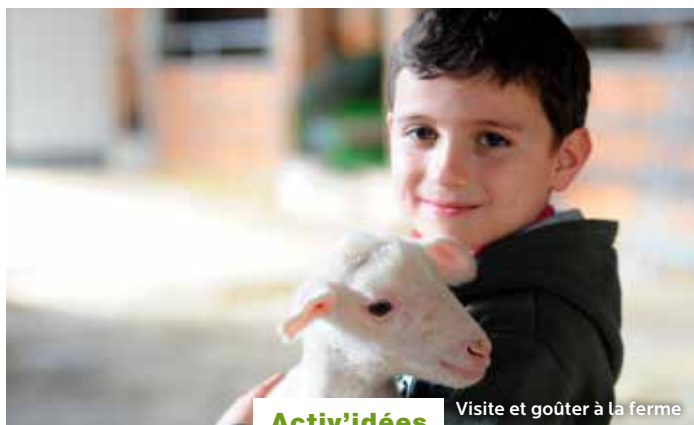
Activ'idées Visite et goûter à la ferme

Situé au cœur du territoire des Causses et des Cévennes, classé au patrimoine mondial de l'Humanité par l'Unesco, le village de Nant, bourg médiéval, bénéficie d'une localisation idéale pour pratiquer une palette d'activités inépuisable pour petits et grands ! Pays d'eau-vive et de soleil, bienvenue en Aveyron en terres d'émotions.