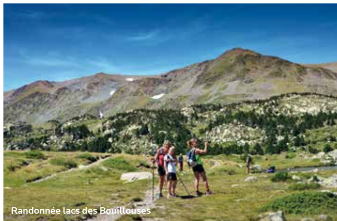
Randonnée lacs des Bouillouses