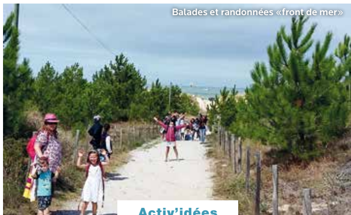
Balades et randonnées «front de mer»

L es Buissonnets, c'est la cachette parfaite pour vos vacances à la mer ! Blotti dans la pinède, cet accueillant village vacances ouvre sur une longue plage blonde, à deux pas de la forêt de Suzac et à l'embouchure de l'estuaire de la Gironde (sites naturels protégés). En famille ou entre amis, vacances relaxantes garanties !