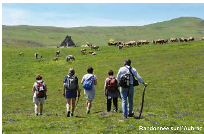
Randonnée sur l'Aubrac