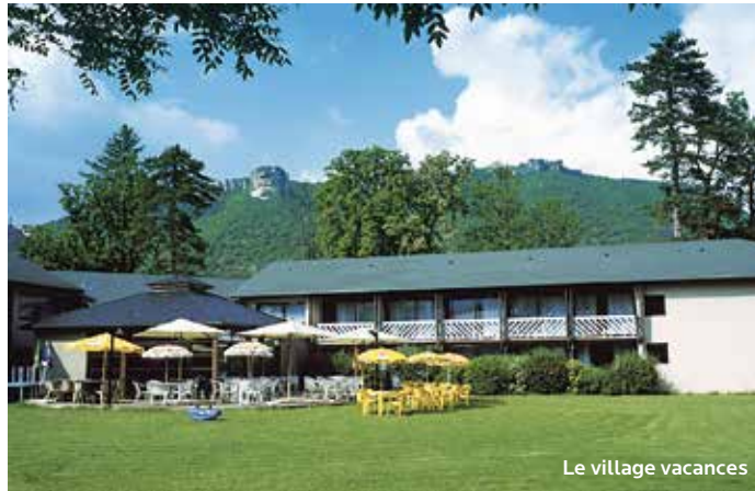
Le village vacances