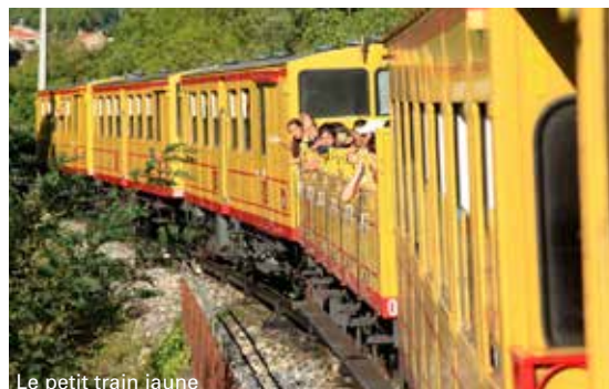
Le petit train jaune

Du 6/07 au 24/08/2019, les points forts du programme : • clubs enfants de 3 à 6 ans et de 7 à 10 ans : apprentissage du feu, taille de pierre, poterie, olympiades, pêche. • clubs pré-ados de 11 à 13 ans et clubs ados : baignades, atelier culinaire, balade aux Gorges de Gouleyrous, descente en raft ou accro-branche.