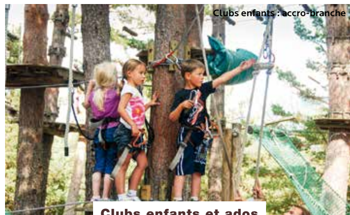
Clubs enfants : accro-branche

Bons plans : tarifs préférentiels pour toutes les activités de la base nautique (planches à voile, catamarans, bateaux à pédales, kayaks, canoës...) mais aussi chiens de traîneaux, jeux gonflables, laser game outdoor, mini-golf, trampolines ascensionnels, accro-branche, tir à l'arc.