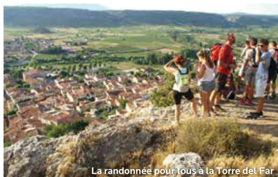
La randonnée pour tous à la Torre del Far