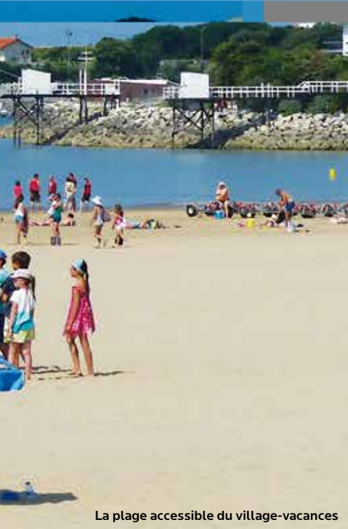
La plage accessible du village-vacances