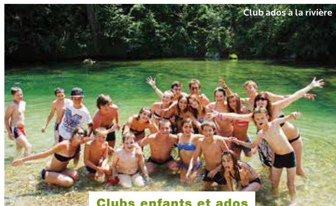
Club ados à la rivière