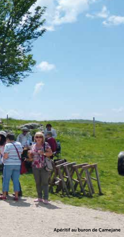
Apéritif au buron de Camejane