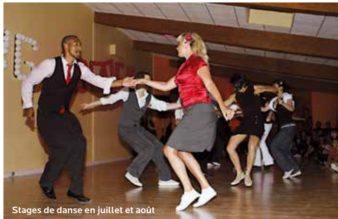
Stages de danse en juillet et août