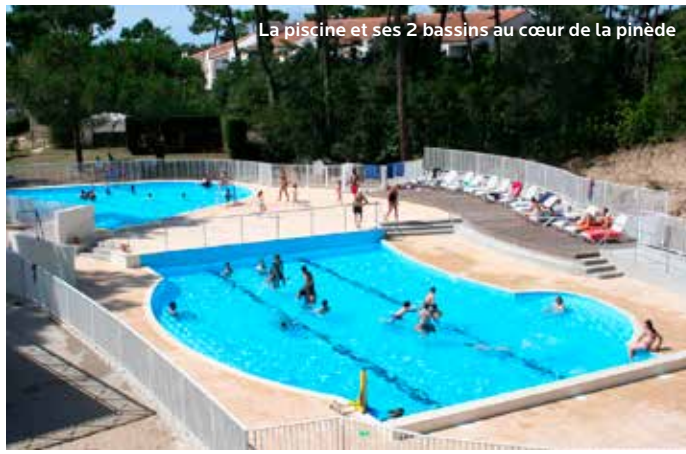
La piscine et ses 2 bassins au cœur de la pinède