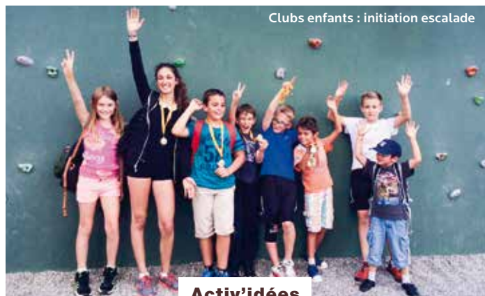
Clubs enfants : initiation escalade

Le Capcir offre un panorama unique dans les Pyrénées avec ses lacs et forêts. La station des Angles, vieux village catalan, vous offre l'authenticité du milieu montagnard et propose de nombreuses activités pour adultes et enfants de tout âge. Les Pyrénées catalanes... des vacances inoubliables à vivre en famille.