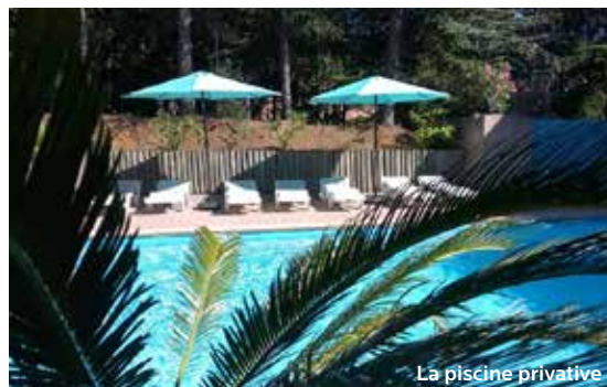
La piscine privée