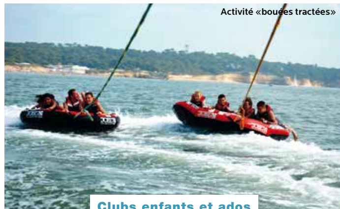
Activité «bouées tractées»