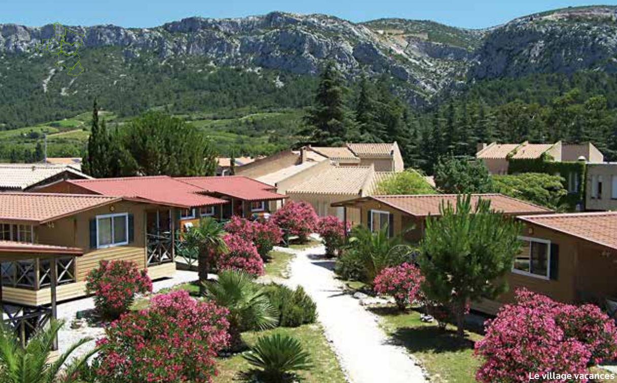
Le village vacances