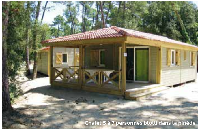
Chalet 5 à 7 personnes blotti dans la pinède